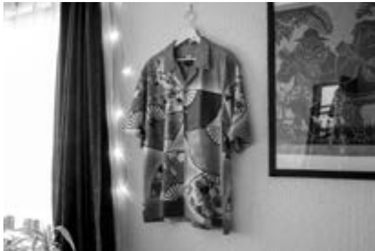
完成したアロハシャツ