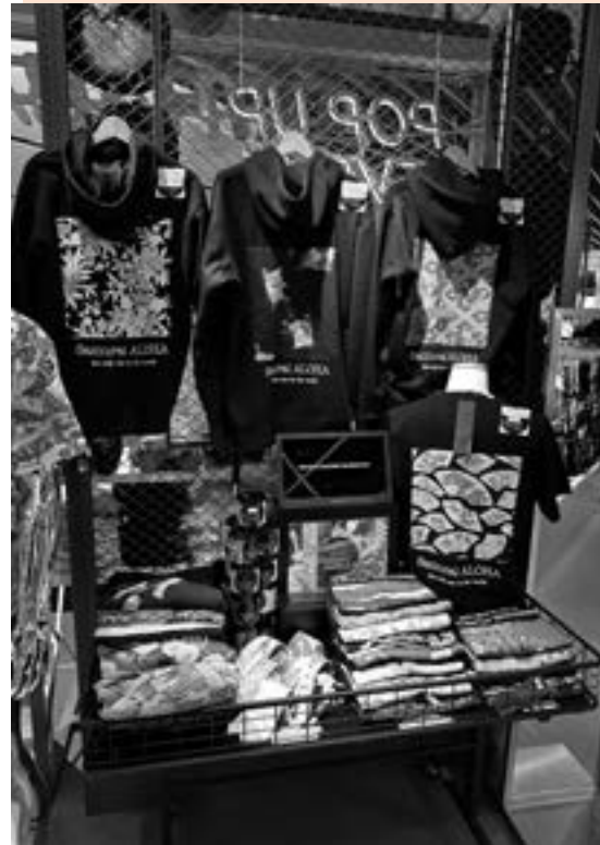
成田空港第二ターミナル免税フロア AKIHABARA+